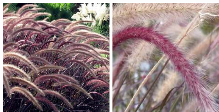
03 | ESPÉCIE: Capim do texas ou Pennisetum setaceum