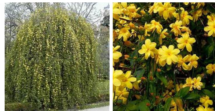
07 | ESPÉCIE: Jasmim Amarelo ou Jasminum