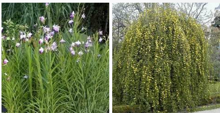
06 | ESPÉCIE: Orquídea Bambu ou Arundina bambusifolia