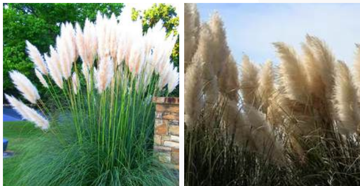
02 | ESPÉCIE: Capim-dos-pampas ou Cortaderia selloana