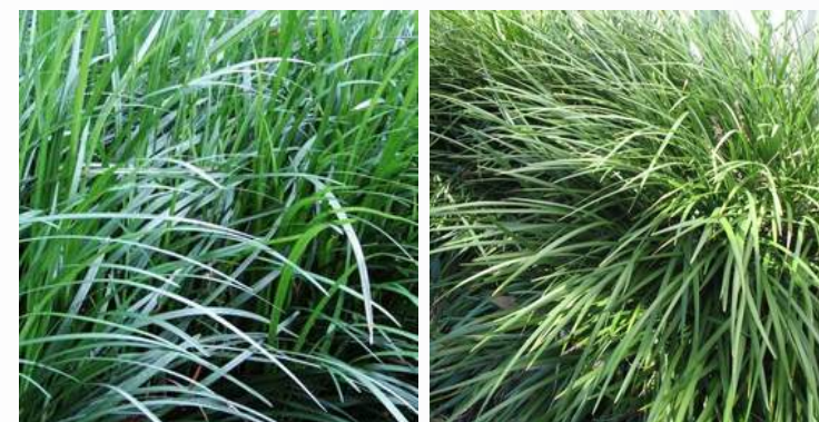
05 | ESPÉCIE: Barba-de-serpente ou Ophiopogon jaburan