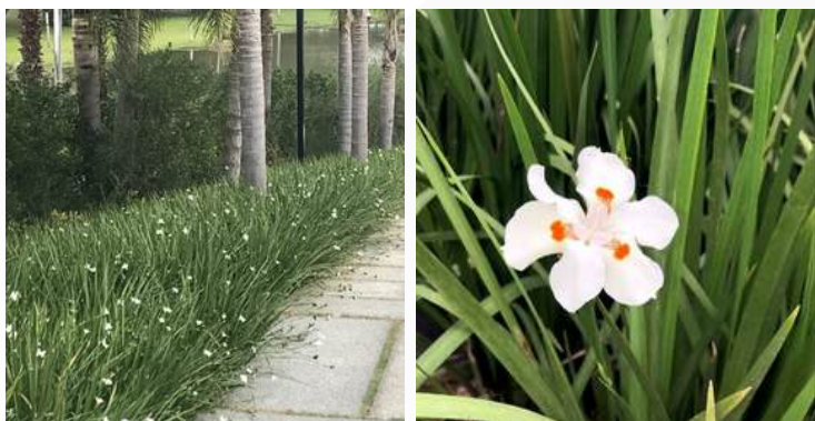
08 | ESPÉCIE: Moreia Branca ou Dietes iridioides