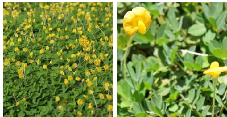
01 | ESPÉCIE: GRAMA AMENDOIM ou Arachis repens