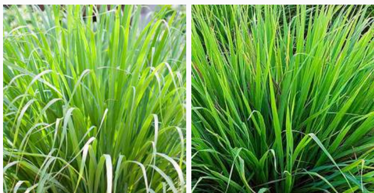
04 | ESPÉCIE: CAPIM-LIMÃO ou Cymbopogon citratus