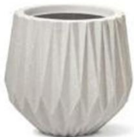
Modelo de referência - Vaso cerâmico, modelo diamante - Origami