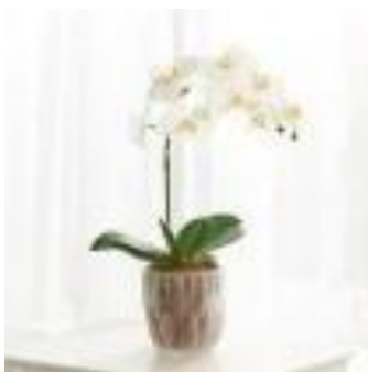
Modelo de referência - Arranjo de Orquídea Toque Real em Vaso de Vidro

Altura planta dobrada: 42 cm / Largura: 22 cm Altura vaso: 13 cm / Largura: 13 cm